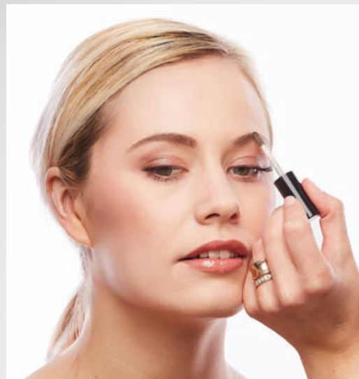
Smukke bryn på sekunder!